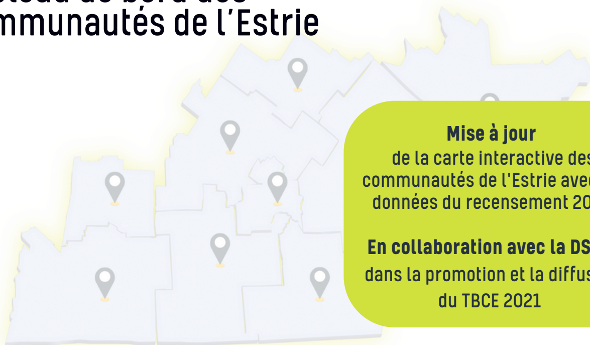
Tableau de bord des communautés de l'Estrie

Mise à jour de la carte interactive des communautés de l'Estrie avec les données du recensement 2021.