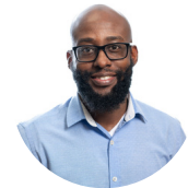
Stevens Simplus Agent en mobilisation des connaissances